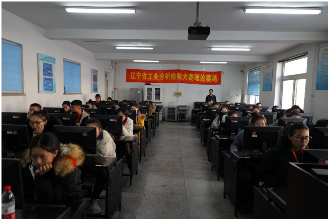
理论+仿真考试比赛现场

12 月 11 日，参赛各队在省大赛组委会和比赛监督的主持下完成了比赛场次的抽签工作。12 月 12 日 8:30，比赛正式开始，比赛分为理论+仿真考核、化学分析操作考核、仪器分析操作考核三个竞赛单元，每个竞赛单元都在规定时间内顺利完成，于 12 月 14 日晚 13:00 分全部结束。