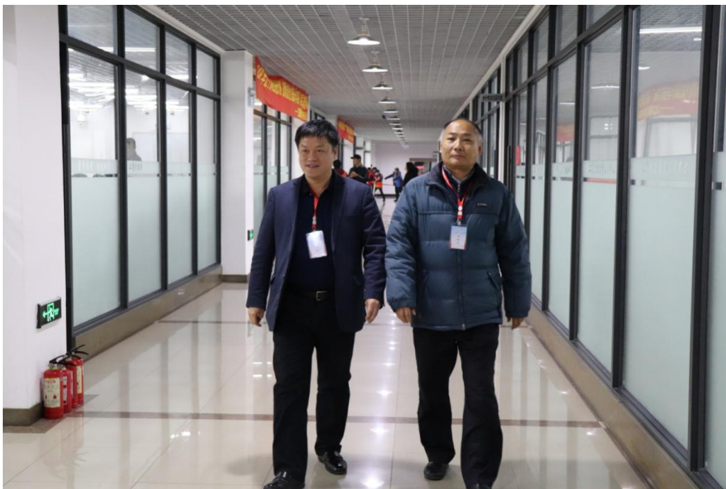
教育厅职业与成人教育处处长苏云海亲临方案设计大赛现场

2018年11月30日-12月2日，由辽宁省教育厅主办，辽宁装备制造职业技术学院承办、沈阳艾杜科技有限公司和深圳市中诺思科技股份有限公司提供技术支持的“2019 年辽宁省职业院校技能大赛（高职组）智慧物流作业方案设计与实施”赛项在辽宁装备制造职业技术学院成功举办。本届大赛共有19所高职院校的30支参赛队120名选手、45位指导老师和20位裁判专家参加，是我省举办智慧物流大赛以来参赛学校最多、参赛队伍最多、参赛选手最多的一次。辽宁省教育厅职业与成人教育处处长苏云海亲自视察了方案设计比赛场地，详细询问了各个环节的准备情况，最后对大赛准备工作给予了充分肯定。任庆国校长亲临方案实施比赛现场对参赛选手和指导教师以及大赛工作人员们进行了亲切慰问，并对大赛的组织工作予以充分肯定。