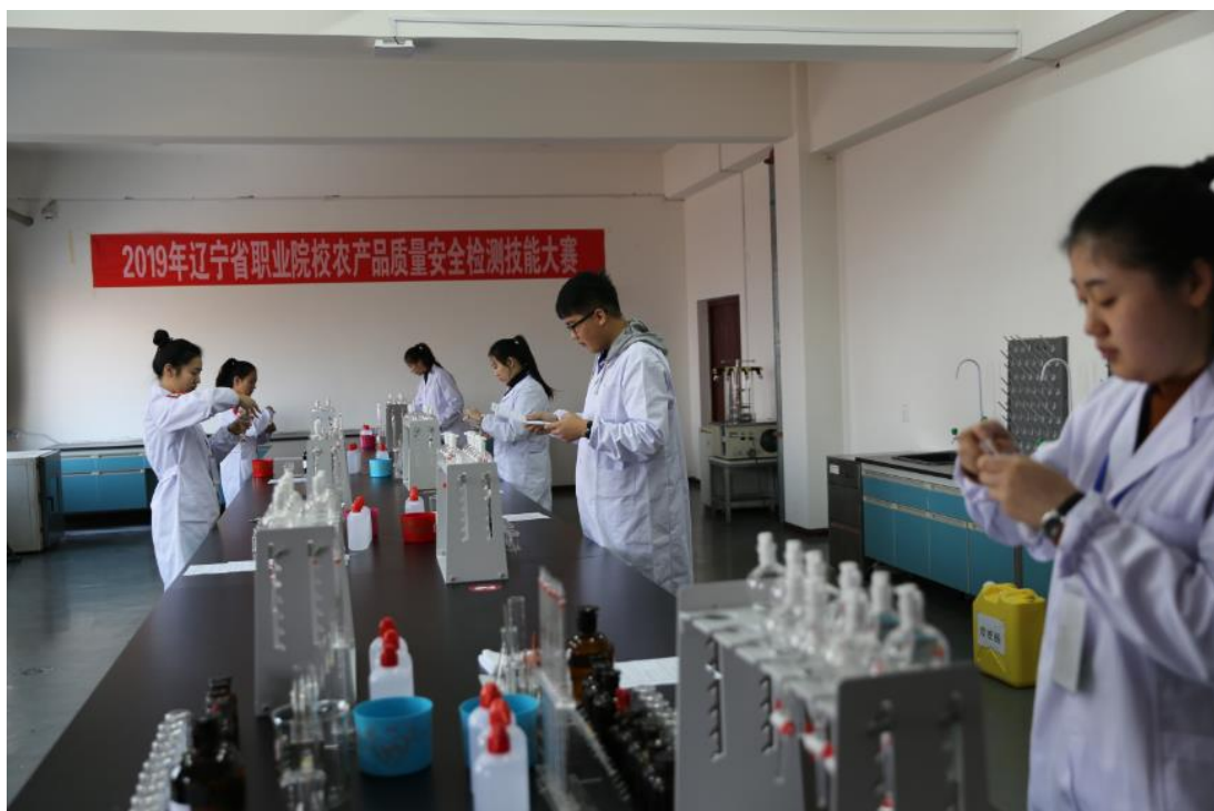
2019年辽宁省职业院校技能大赛农产品质量检测赛项重金属检测比赛现场