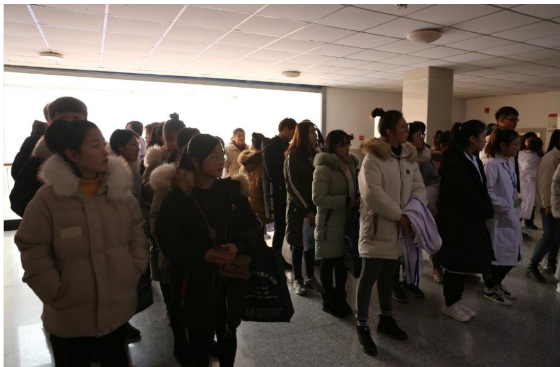
2019年辽宁省职业院校技能大赛农产品质量检测赛项赛前检录

菜中有机磷类农药残留的检测”的检测分预处理、工作站使用和数据处理三个部分。三个部分于19日11点30分全部结束。经过裁判认真、公正的评分与计算，最终确定分数与名次。