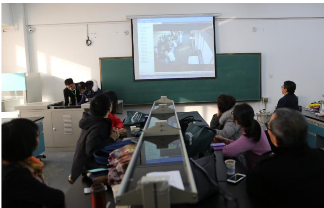
各参赛队领队、指导教师在休息室观看实时赛况

有效的农产品质量安全检测是监管和保证农产品质量安全的重要手段。本赛项是农产品质量安全检测相关专业高职学生实战锻炼和展示能力的平台，也为学校间扩大交流、寻找差距，共同进步提供机会，为乡村振兴战略和农业科技人才队伍培养提供支撑。农产品质量安全检测对象主要包括农药残留、重金属和其它